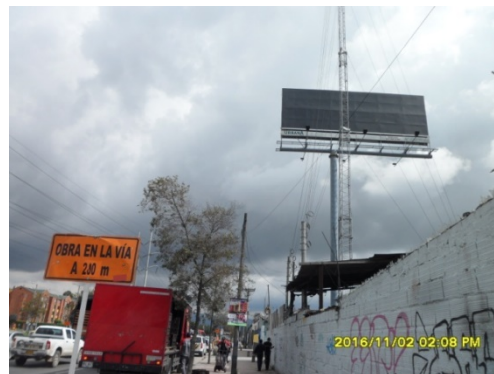
VISTA PANORAMICA-SENTIDO OESTE-ESTE