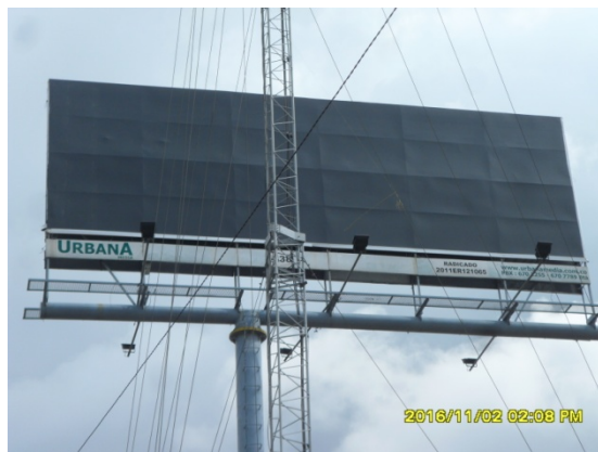
SENTIDO OESTE-ESTE SIN AVISO PUBLICITARIO